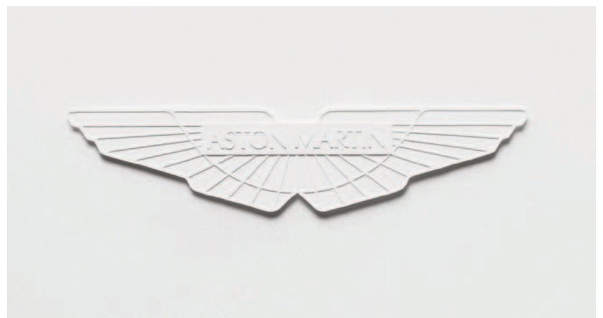
TENTE ASTON: Det er dette verket «Aston Martin Paper Sculpture», lagd av hvitt papir, som fikk luksusbilprodusenten til å tenne.